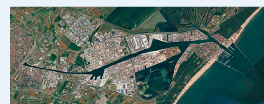
IMMAGINE DEL PORTO DI RAVENNA

Da sempre il porto di Ravenna è caratterizzato da un'attività "multipurpose", caratterizzata dalla versatilità e varietà delle merci movimentate. All'interno di questa varietà la movimentazione dei prodotti siderurgici di grandi dimensioni ( coils, lamiere, tubi e profilati metallici in genere) riveste un ruolo di primo piano per quantità di merce movimentata e implicazioni tecniche e strumentali necessarie. Allo stesso tempo risulta evidente come tali materiali posseggano, per le loro dimensioni e peso, un rischio potenziale estremamente grave per gli effetti che si avrebbero, in caso di incidente, nella loro movimentazione. Se da un lato l'imbarco/sbarco di questi prodotti dalle navi, con l'utilizzo di GRU, garantisce di norma un sufficientemente standard di sicurezza, richiede certamente maggiore attenzione l'analisi della movimentazione sui piazzali: gli infortuni e gli incidenti avvenuti negli anni passati nel porto di Ravenna e la memoria legata alla vigilanza condotta dal Servizio hanno suggerito, al fine della prevenzione di infortuni gravi o mortali, di approfondire la tematica della sicurezza nella movimentazione di questi prodotti attraverso il "Piano Mirato di Prevenzione" all'interno del progetto finanziato e coordinato da Inail Ricerca, DiMEILA.