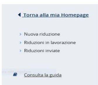
Figura 3.1 - Menù di sinistra