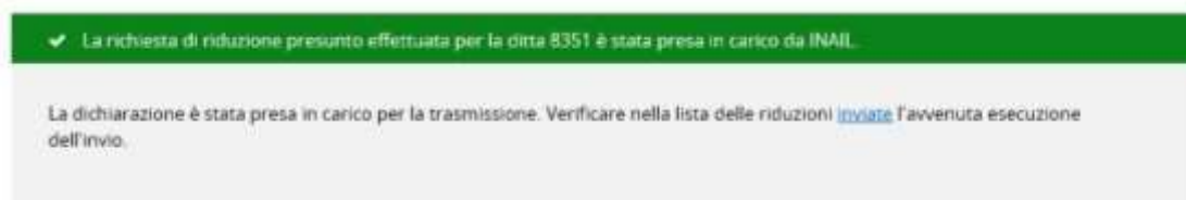
Figura 3.13 – Conferma invio riduzione