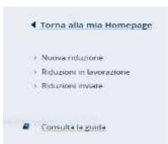
Figura 3.1 - Menù di sinistra