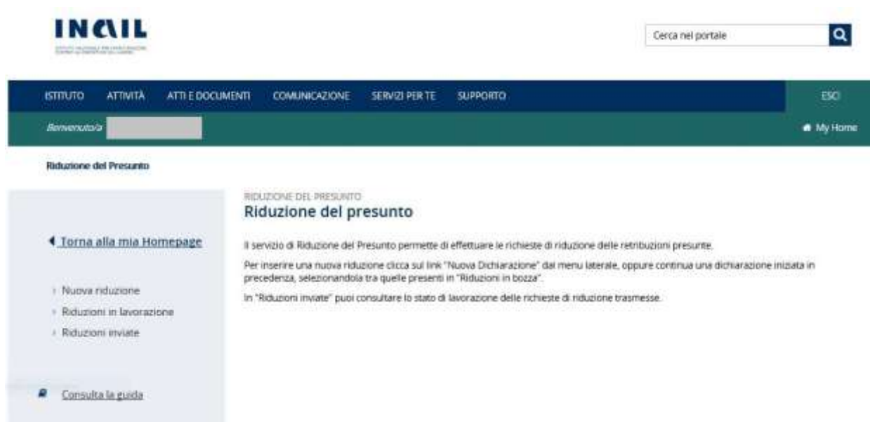
Figura 2.2 - Riduzione del Presunto

Una volta effettuata l'autenticazione e aver selezionato il servizio Riduzione del presunto l'utente accede alla maschera principale del servizio (Figura 2.2)