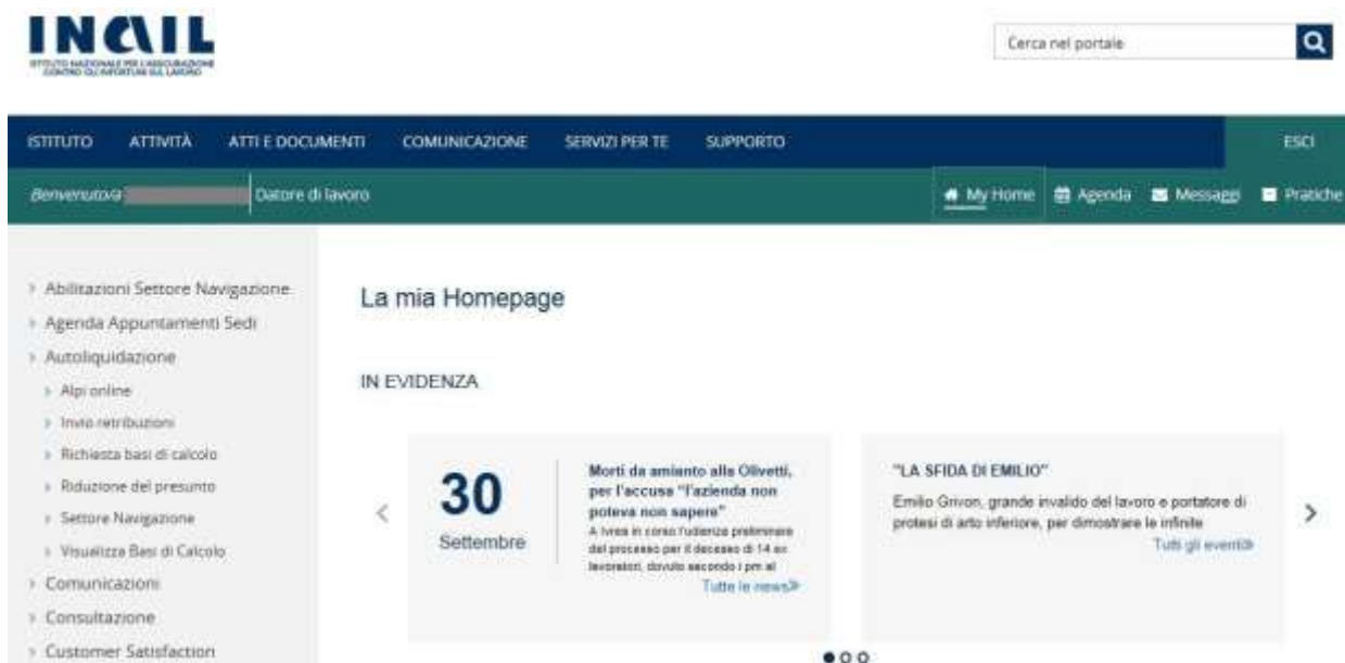
Figura 2.1 Menù di accesso

Le aziende e gli altri soggetti assicuranti, titolari di codice ditta, dopo essersi collegati a www.inail.it ed aver inserito nel campo "utente" il codice fiscale e la password nel relativo campo, accedono al servizio dal menù laterale Autoliquidazione – Riduzione del presunto (Figura 2.1).