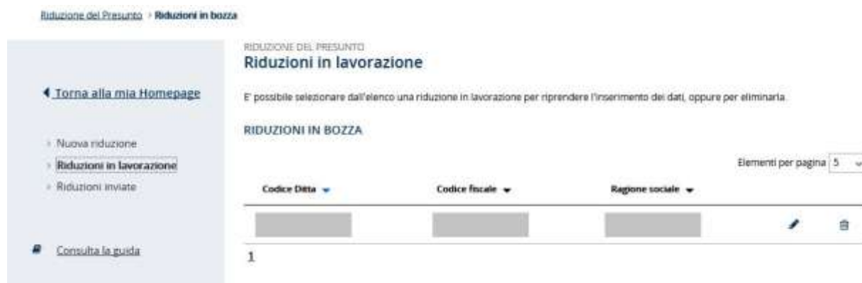
Figura 3.14 – Riduzione in lavorazione

Selezionando il link Riduzioni in lavorazione viene visualizzata la comunicazione di riduzione del presunto inserita e in attesa di essere completata e inviata (Figura 3.14).