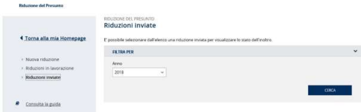
Figura 3.15 – Ricerca riduzioni inviate

Selezionando il link Riduzioni inviate si accede alla maschera di ricerca delle comunicazioni di Riduzione del Presunto inviate (Figura 3.15).