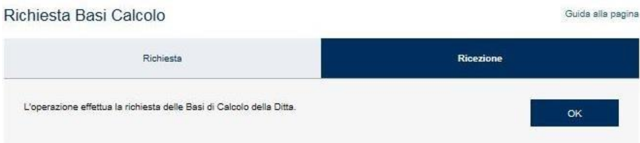
Figura 3.2 – Richiesta Basi di Calcolo

La funzionalità Richiesta consente all'utente di inoltrare la richiesta di produzione del file con le basi di calcolo selezionando il pulsante OK (Figura 3.2).