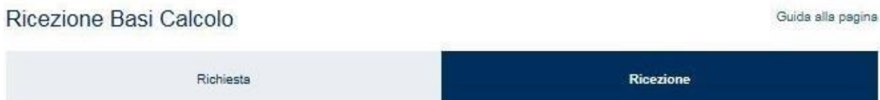
Figura 3.1 – Barra di navigazione – Funzioni disponibili

All'accesso iniziale è visualizzato l'elenco dei file delle Basi di Calcolo disponibili per la ricezione.