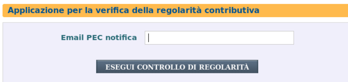
Figura 2: Richiesta Regolarità "Azienda"

Se l'utente autenticato al portale è un'azienda (impresa, lavoratore autonomo o altro soggetto tenuto ad essere iscritto all'Inail e titolare di codice ditta) il form di inserimento dati sarà il seguente ( Figura 2 ).