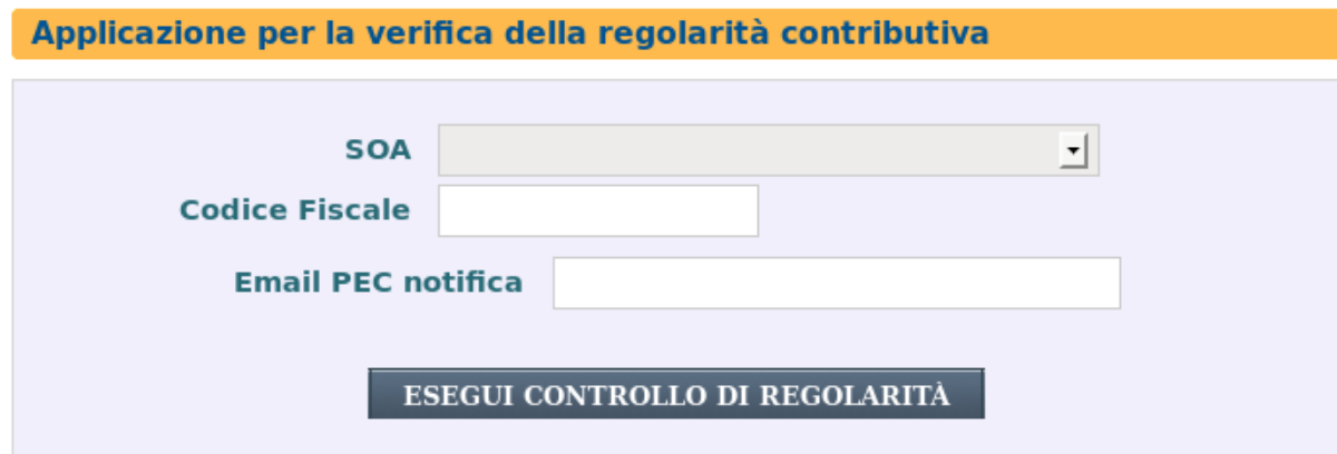
Figura 5: Richiesta Regolarità "SOA"

Se l'utente autenticato al portale è una Società Organismo Attestazione, cioè un utente registrato in www.sportellounicoprevidenziale.it come SOA, il form di inserimento dati sarà il seguente (Figura 5).