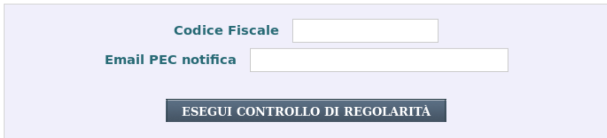
Figura 3: Richiesta Regolarità "Intermediari"

Nel campo codice fiscale deve essere inserito il codice fiscale dell'azienda (impresa, lavoratore autonomo o altro soggetto tenuto ad essere iscritto all'Inail e titolare di codice ditta) di cui si vuole verificare la regolarità.