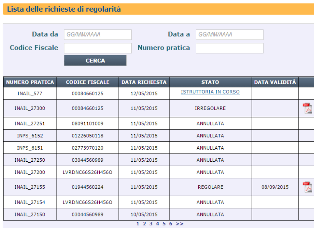
Figura 11: Lista Richieste

Cliccando sulla voce di menu “ Lista Richieste ” ( Figura 1 ) l’utente visualizza la lista delle richieste di regolarità che ha inviato ( Figura 11 ).