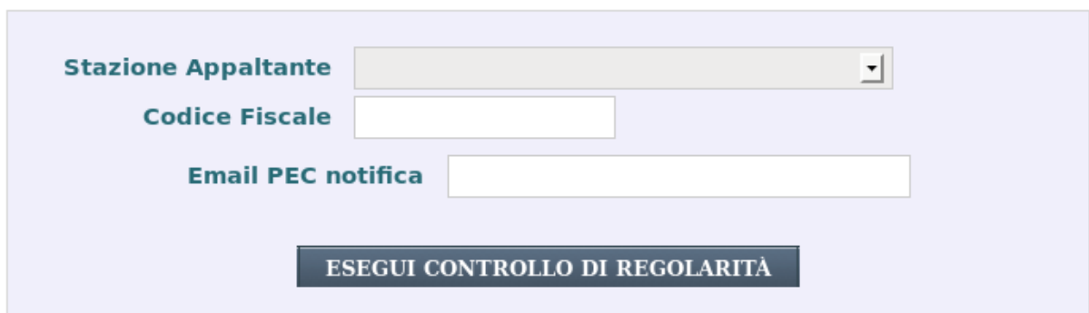
Figura 4: Richiesta Regolarità "Stazioni Appaltanti"

Nel campo codice fiscale deve essere inserito il codice fiscale dell'azienda (impresa, lavoratore autonomo o altro soggetto tenuto ad essere iscritto all'Inail e titolare di codice ditta) di cui si vuole verificare la regolarità.