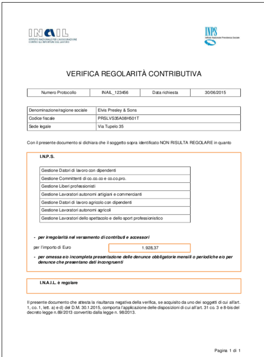
Figura 14: Documento di non regolarità

Il sistema visualizza il relativo documento ( Figura 14 ).