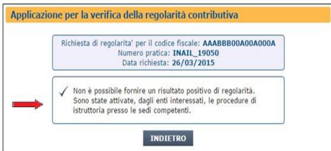
Figura 10: Richiesta in Istruttoria

Con apposito messaggio il sistema avverte l'utente ( Figura 10 ).