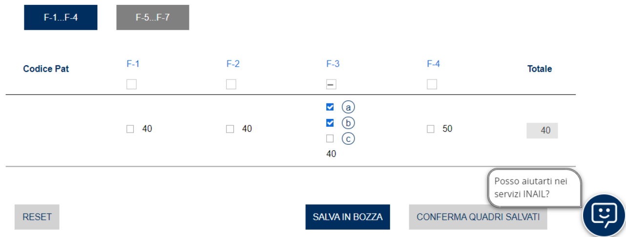
Fig. 4- Selezione intervento valido per specifiche PAT prevedendo l'attuazione di almeno due fra le misure di protezione per i dipendenti dal rischio rapine elencate nell'intervento medesimo

PER L'INTERVENTO F3, IL NUMERO MINIMO DI CHECK È 2