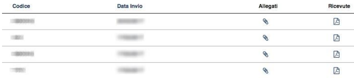
Fig. 10 – Lista Inviata