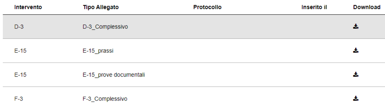
Fig. 11 – Lista Allegati