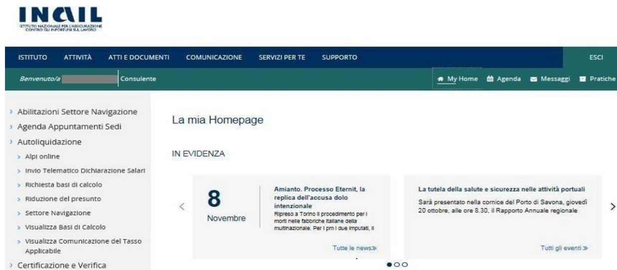
Figura 2.1 Menù di accesso

Gli intermediari abilitati, dopo aver effettuato l'accesso al Portale INAIL mediante le proprie credenziali SPID, CNS o CIE, dalla pagina My Home selezionano il servizio dal menù laterale Autoliquidazione – Visualizza Comunicazione del Tasso Applicabile (Figura 2.1).