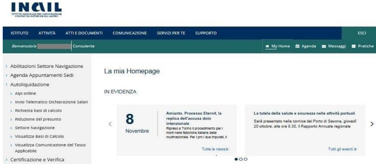
Figura 2.1 Menù di accesso

Gli intermediari abilitati, dopo aver effettuato l'accesso al Portale INAIL mediante le proprie credenziali SPID, CNS o CIE, dalla pagina My Home selezionano il servizio dal menù laterale Autoliquidazione – Visualizza Comunicazione del Tasso Applicabile (Figura 2.1).