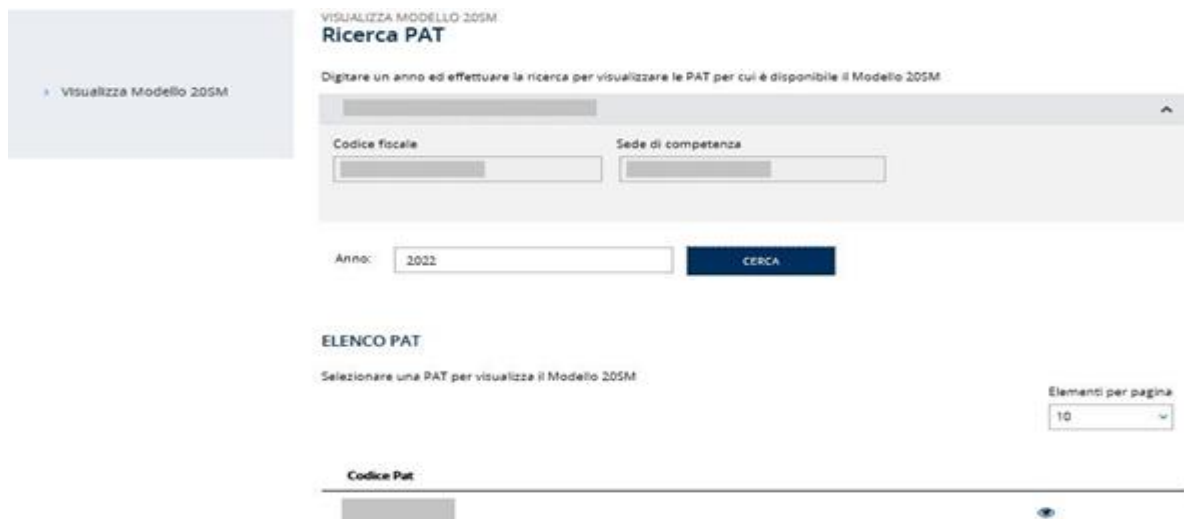
Figura 3.1 – Elenco PAT

Nel menù laterale, invece, il link Visualizza Modello 20SM riporta all'elenco delle deleghe. L'utente inserisce nell'apposito campo l'anno di interesse e attivando il tasto CERCA, visualizza l'elenco delle PAT per cui è disponibile la visualizzazione della Comunicazione del Tasso Applicabile, per l'anno di interesse (Figura 3.2). È possibile visualizzare i modelli solo a partire dall'anno 2019.