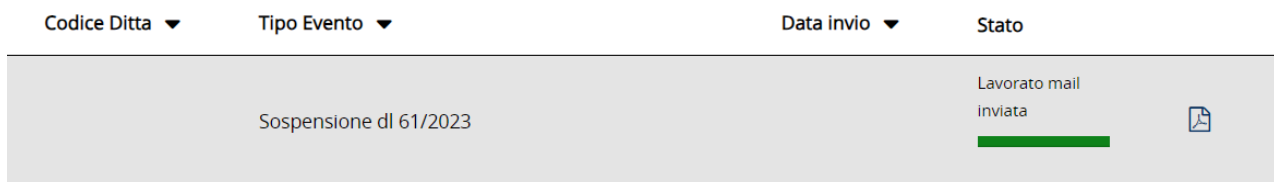
Figura6 Elenco comunicazioni inviate

Nella colonna Stato è possibile visualizzare l'iter della comunicazione inviata: