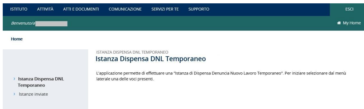
Figura 2.1 - Istanza Dispensa DNL Temporaneo – Pagina iniziale

Le aziende e gli altri soggetti assicuranti, dopo aver effettuato l'accesso al Portale INAIL mediante le proprie credenziali SPID, CNS o CIE, dalla pagina My Home selezionano il servizio dal menù laterale Denunce – Istanza dispensa DNL Temp e accedono alla maschera iniziale (Figura 2.1).