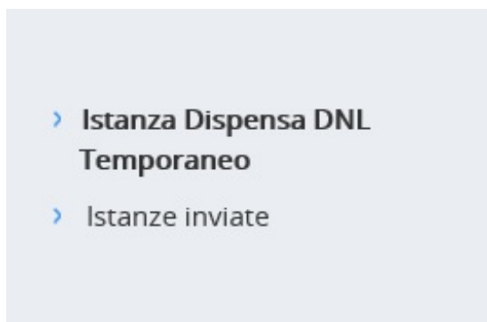
Figura 3.1 – Menù laterale – Funzioni disponibili