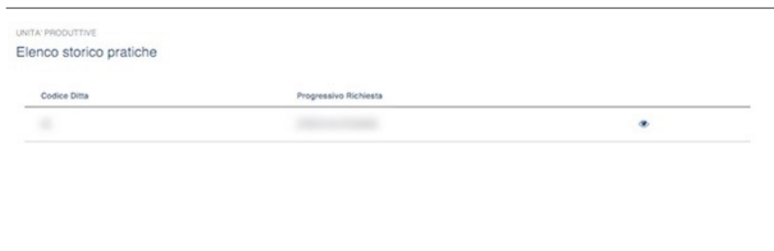
Figura 10 - Elenco storico pratiche

Il pulsante "STAMPA", in fondo a destra, consente di stampare il dettaglio informativo in PDF .