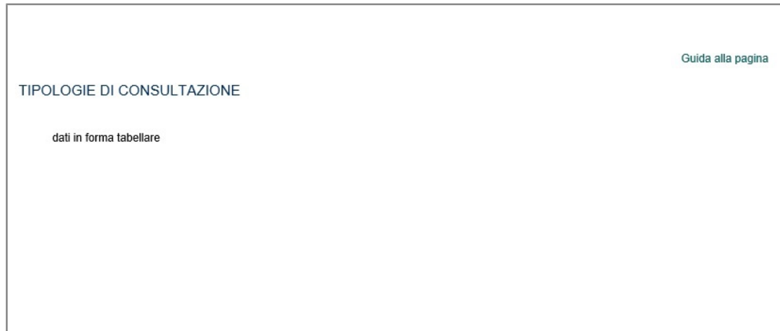
Figura 1 - Home page Patronato Zonale