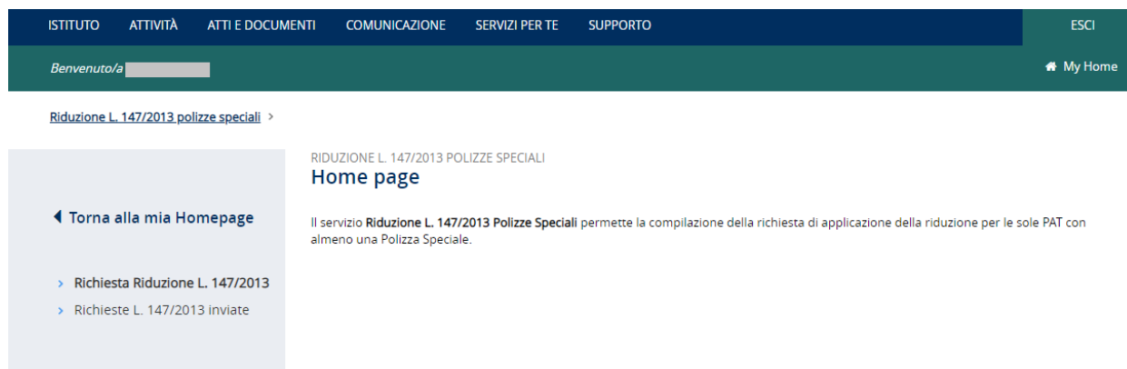
Figura 2.1 – Pagina iniziale

Gli intermediari abilitati dopo aver effettuato l'accesso al Portale INAIL mediante le proprie credenziali SPID, CNS o CIE, dalla pagina My Home selezionano il servizio dal menù laterale Denunce – Riduzione L. 147/2013 Polizze Speciali e accedono alla pagina iniziale (Figura 2.1).