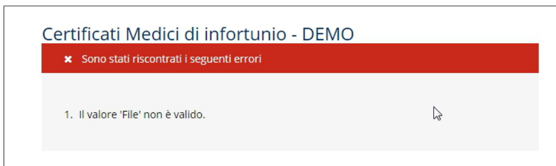
Figura 4 - Esito negativo