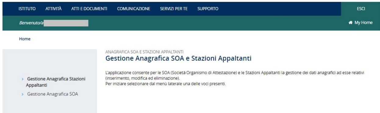
Figura 2.3 Pagina principale dell'applicazione

Attraverso la selezione delle voci presenti nel menù laterale, l'utente accede alla gestione della specifica anagrafica. La selezione di ciascuna delle due voci consente la visualizzazione dei sottomenù (Figura 2.4) da cui è possibile effettuare: