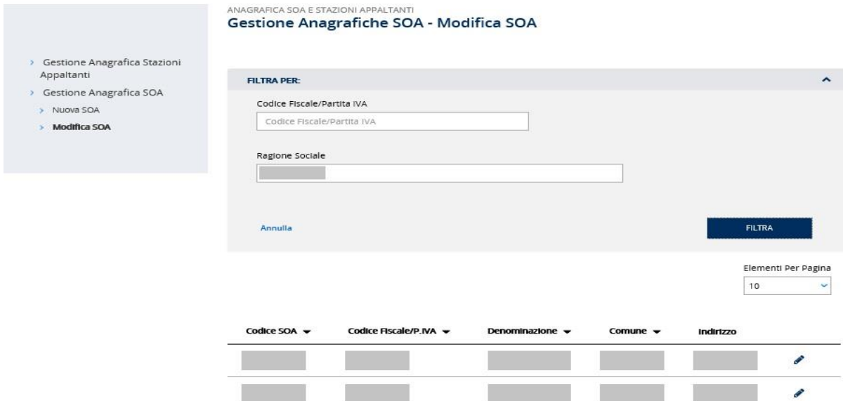
Figura 4.2 Ricerca anagrafiche SOA

La selezione del link posto accanto a ciascuno dei risultati in elenco consente l'accesso al dettaglio dell'anagrafica della SOA (Figura 4.3).