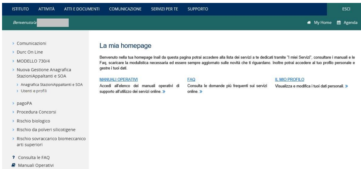
Figura 2.2 Nuova voce di menù

Dalla pagina My Home seleziona la nuova voce di menù Nuova Gestione Anagrafica Stazioni appaltanti e SOA e successivamente la sottovoce Anagrafica Stazioni Appaltanti e SOA (Figura 2.2).