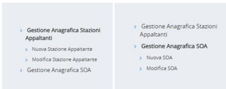
Figura 2.4 Sottomenù delle funzionalità