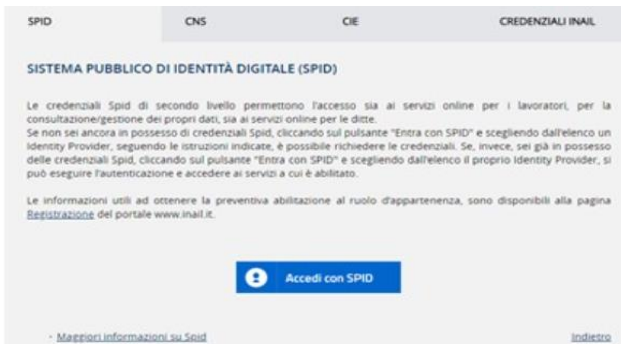
Figura 2.1 Accesso al Portale INAIL

L'utente effettua l'accesso al Portale INAIL mediante le proprie credenziali SPID, CNS o CIE (Figura 2.1).