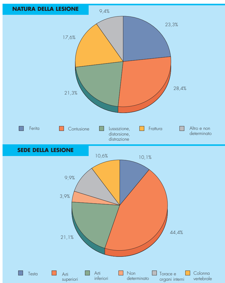
TAV. 2: INFORTUNI DEFINITI POSITIVI NEL SETTORE DELLA PRODUZIONE DEI PRODOTTI DA FORNO E FARINACEI PER NATURA E SEDE DELLA LESIONE - ANNO DI ACCADIMENTO 2017

Si dice da sempre buono come il pane. In effetti il pane oggi come ieri rappresenta l'alimento più consumato e più apprezzato nella vasta gamma dei prodotti da forno della panetteria, pasticceria e biscotteria. Pur cambiando gli stili di vita e le abitudini alimentari, si stima per i prodotti da forno un mercato ancora in potenziale espansione ed un valore a livello mondiale, secondo la ricerca condotta da Research and Markets, che dovrebbe superare i 570 miliardi di dollari entro il 2024. In Italia i dati Istat per il 2017 indicano un incremento, rispetto all'anno precedente, della produzione industriale in quantità e valore pari rispettivamente a +5,1% e +2,5%. La produzione di prodotti da forno con 34 mila aziende assicurate all'Inail, oltre 40 mila Pat e 143 mila addetti-anno, rappresenta il 68% delle aziende e il 38% dei lavoratori del settore dell'industria alimentare. Gli infortuni sul lavoro nel 2017 sono stati 2.880 (circa il 37% del comparto alimentare), in calo del 6% nel quinquennio e in sostanziale stabilità rispetto al 2016. Annualmente le vittime sul lavoro sono sotto la decina, 8 nell'ultimo anno. L'85% degli infortuni avviene in occasione di lavoro e di questi circa 150 casi l'anno vedono coinvolto un mezzo di trasporto. Il 64% delle denunce ha riguardato gli uomini, i più colpiti anche dagli eventi mortali (85% in media nel quinquennio); il 38% degli infortunati ha un'età compresa tra i 35 e