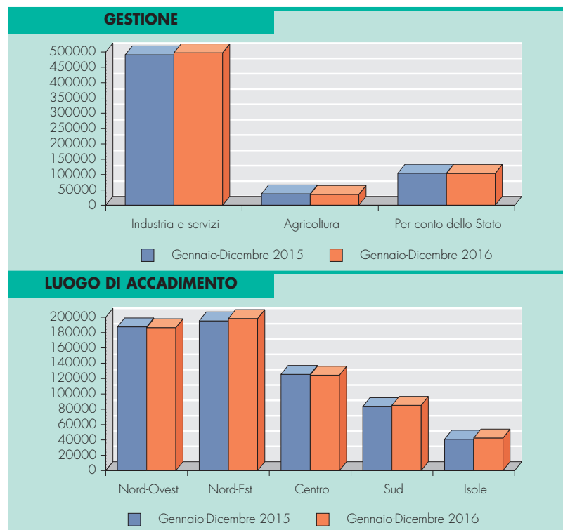
TAV. 1: DENUNCE D'INFORTUNIO PER GESTIONE E LUOGO DI ACCADIMENTO

Sarà in occasione della presentazione della Relazione Annuale a metà anno (con il primo aggiornamento semestrale del 30 aprile 2017) che verranno divulgati ufficialmente i dati infortunistici e tecnopatici 2016 (che si consolide-