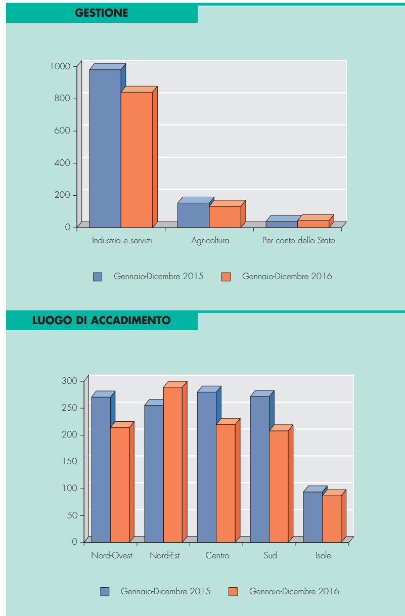
TAV. 2: DENUNCE D'INFORTUNIO CON ESITO MORTALE PER GESTIONE E LUOGO DI ACCADIMENTO

vezione sulle denunce di malattia professionale fa riscontrare, anche per il 2016, un aumento delle denunce (+2,3%, da 59 mila nel 2015 a 60 mila nel 2016), ma