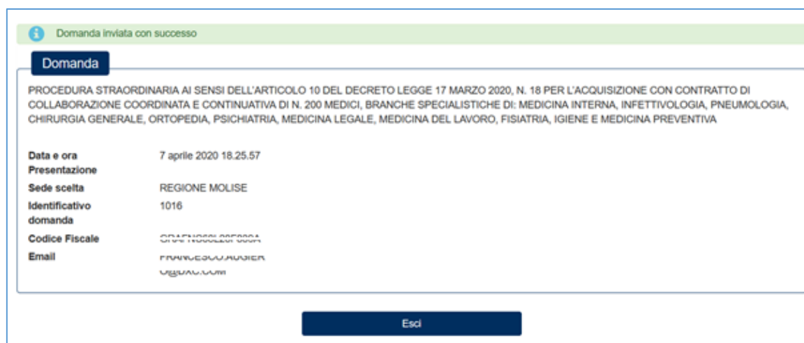
Figura 17 – Invio della domanda – data e ora presentazione

Le stesse informazioni saranno disponibili in una ricevuta che sarà possibile scaricare nella sezione “Visualizza domande”.