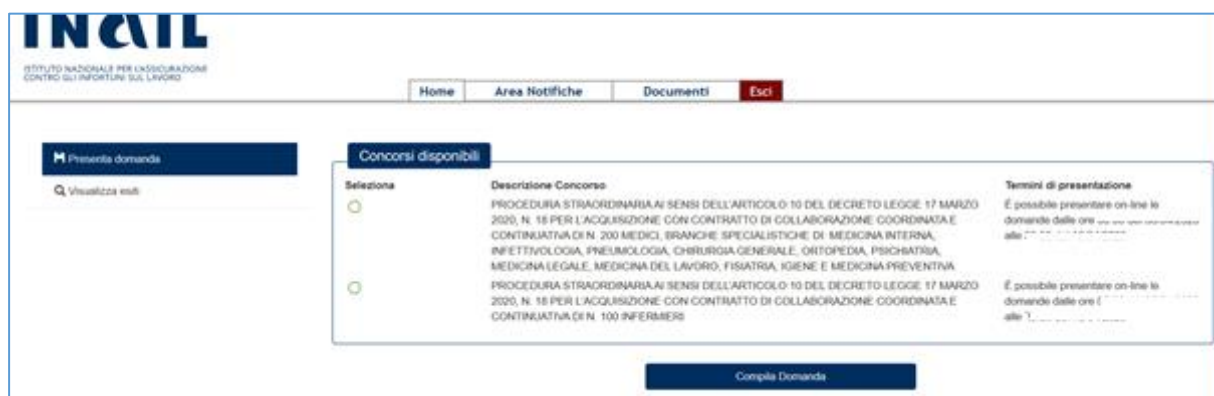
Figura 2 - Pagina della domanda

Nel riquadro "Avvisi disponibili" saranno elencati gli avvisi disponibili sulla base della scelta effettuata.