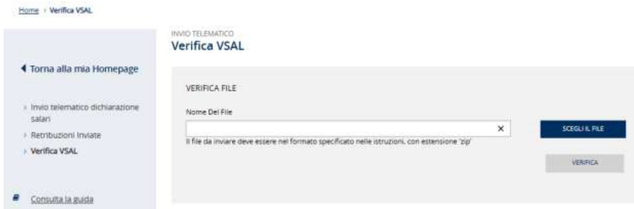
Figura 3.9 – Verifica VSAL

Selezionando la voce di menù Verifica VSAL si accede alla funzionalità che consente di eseguire un controllo formale del file prodotto prima di procedere all'invio (Figura 3.9).