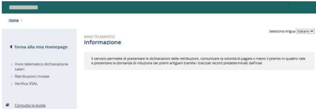
Figura 2.2 – Invio Telematico – Selezione lingua

Selezionando dal menù laterale il link Invio Telematico Dichiarazione Salari l'utente accede alla pagina principale. (Figura 2.3).