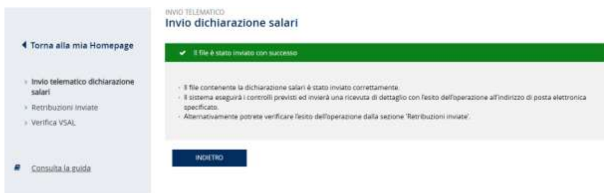
Figura 3.3 – Messaggio di Conferma dell'Operazione

A trasmissione effettuata viene visualizzato il seguente messaggio di conferma dell'operazione (Figura 3.3).