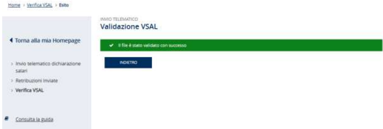
Figura 3.11 – Conferma verifica

Il riepilogo degli errori riscontrati po' essere scaricato in formato .pdf tramite l'apposito link Scarica riepilogo (Figura 3.12).