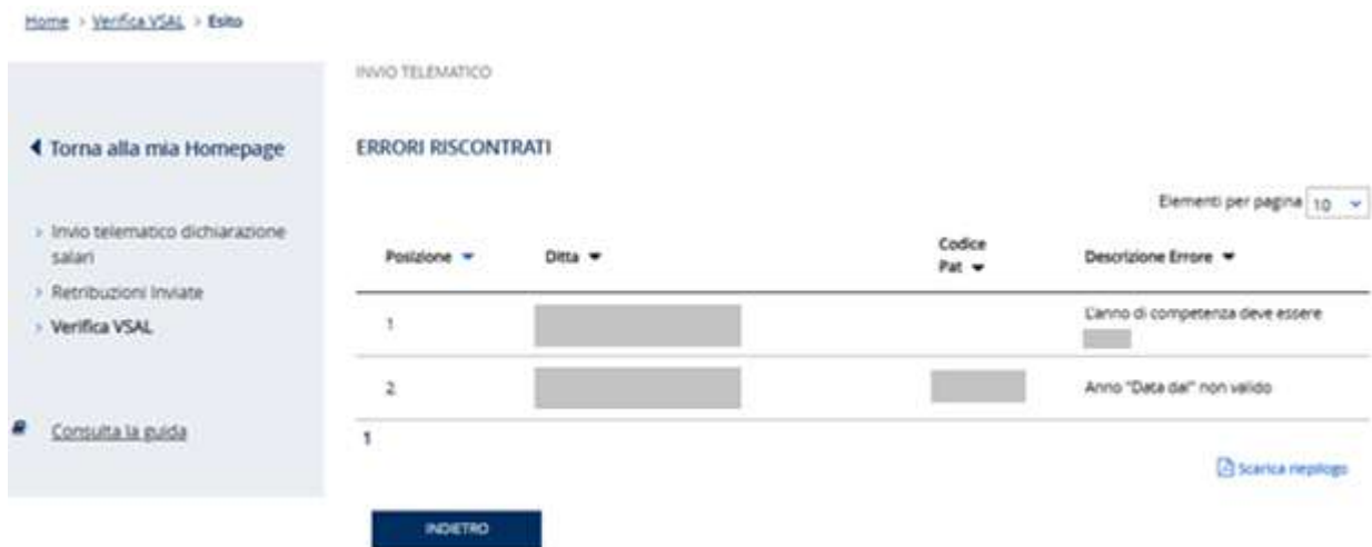
Figura 3.12 – Riepilogo errori

Il riepilogo degli errori riscontrati po' essere scaricato in formato .pdf tramite l'apposito link Scarica riepilogo (Figura 3.12).