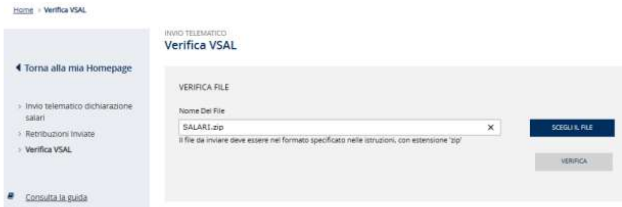
Figura 3.10 – Selezione file

Il file da verificare deve essere nel formato .zip, contenente un tracciato in formato .dat o .json, e tramite il pulsante SCEGLI IL FILE è possibile caricarlo dalla propria cartella (Figura 3.10).