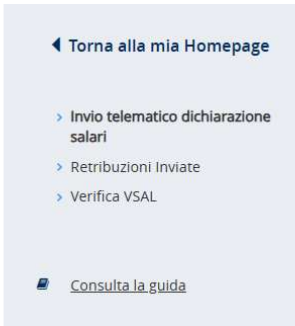
Figura 3.1 – Barra di navigazione – Funzioni disponibili