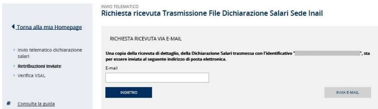
Figura 3.8 – Richiesta ricevuta