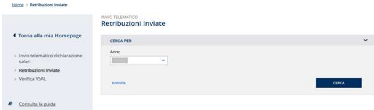
Figura 3.4 – Retribuzioni Inviato

La ricerca può essere effettuata per Anno (Figura 3.5).