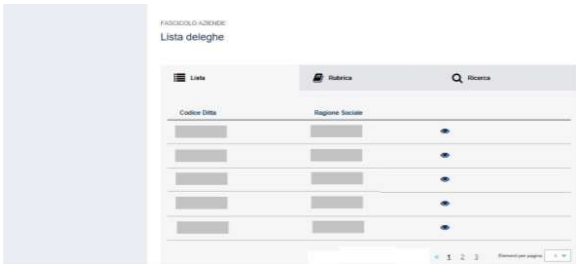
Figura 4.1 Ditte in delega

Effettuato l'accesso all'applicazione, il sistema propone la lista dei codici ditta in delega (Figura 4.1).