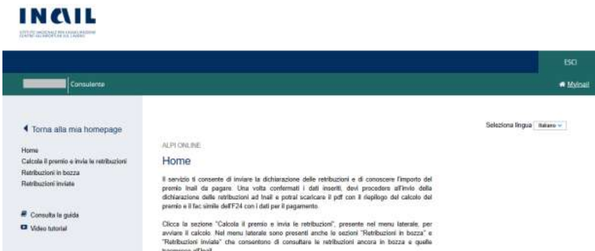
Figura 2.2 – Alpi online – Selezione lingua

L'utente accede alla pagina di Home da cui è possibile selezionare la lingua in cui visualizzare l'applicazione (Figura 2.2). Attualmente le lingue disponibili sono l'italiano e l'inglese.