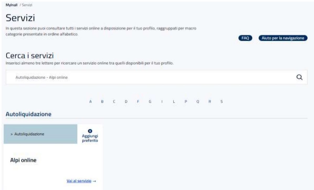
Figura 2.1 Card di accesso

Gli intermediari abilitati effettuano l'accesso al Portale INAIL mediante le proprie credenziali SPID, CNS o CIE e dalla pagina MyInail / Servizi ricercano e selezionano la card Autoliquidazione – Alpi online (Figura 2.1).