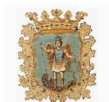
Comune di S. Angelo dei Lombardi