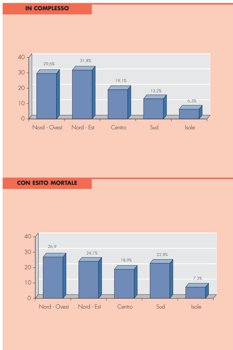
TAV. 2: DENUNCE D'INFORTUNIO PER RIPARTIZIONE GEOGRAFICA - PERIODO DI ACCADIMENTO GENNAIO-DICEMBRE 2018

Gli ultimi incidenti plurimi del 2018 hanno provocato la morte di due dipendenti dell'Archivio di Stato, vittime di una fuga di gas ad Arezzo, di quattro persone travolte da una frana a Isola di Capo Rizzuto, in Calabria, di sette lavoratori coinvolti in tre incidenti stradali avvenuti nel Lazio e in Lombardia e di quattro operai deceduti in Puglia: due edili precipitati nel vuoto da una piattaforma di elevazione, nel corso di lavori di ristrutturazione di uno stabile a