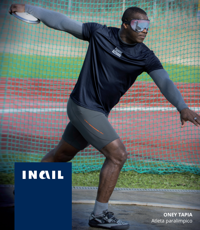
ONEY TAPIA Atleta paralimpico

"UN NUOVO OBIETTIVO È SEMPRE POSSIBILE. ANCHE NEL MONDO DEL LAVORO."