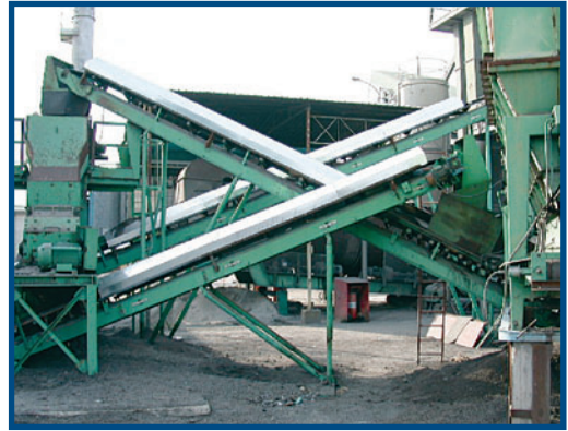
Fig. 25 Zona trasporto inerti prima (a sinistra) e dopo (a destra) la realizzazione della copertura dei nastri trasportatori

Per regolare il traffico veicolare interno si è prescritto di: