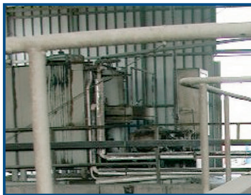
Fig. 23 Situazione dell'area stoccaggio bitume prima (a sinistra) e dopo (a destra) l'intervento di pulizia